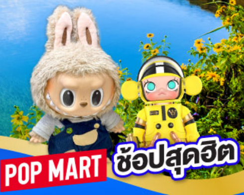
POP MART ซ้อปสุดฮิต