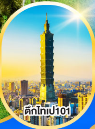
ตึกไท่เปี101