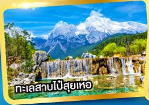
ทะเลสาบไป๋สฺยเหอ