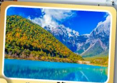
ทะเลสาบไป๋สือเหอ