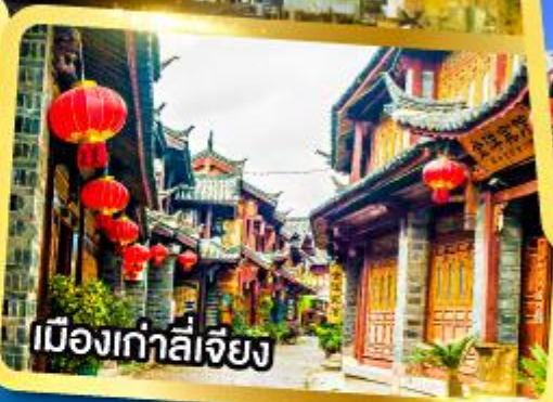
เมืองเก่าลี่เจียง