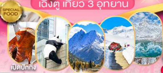
เปิดปิกถึง