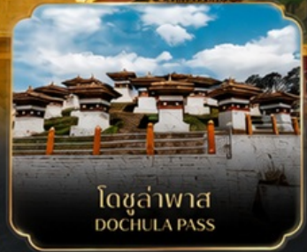
โดชูล่าพาส DOCHULA PASS