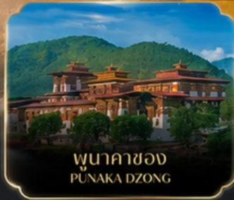
พุนาคาซอง PUNAKA DZONG