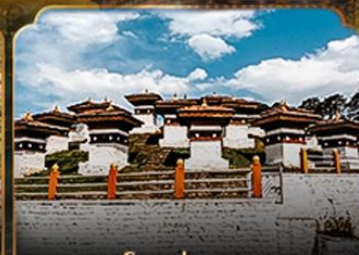
โดชูล่าพาส DOCHULA PASS