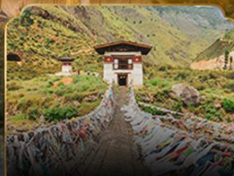
สะพานแขวนพุนาคา PUNAKA SUSPENSION BRIDGE