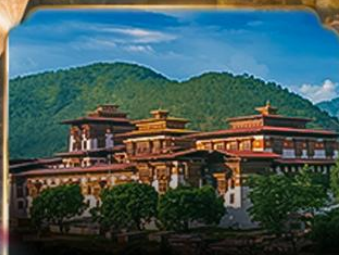
พุนาคาซอง PUNAKA DZONG