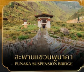
สะพานแขวนพุนาคา PUNAKA SUSPENSION BRIDGE