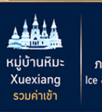
หมู่บ้านหิมะ Xuexiang รวมค่าเช่า