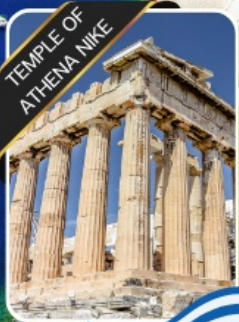
TEMPLE OF ATHENA NIKE