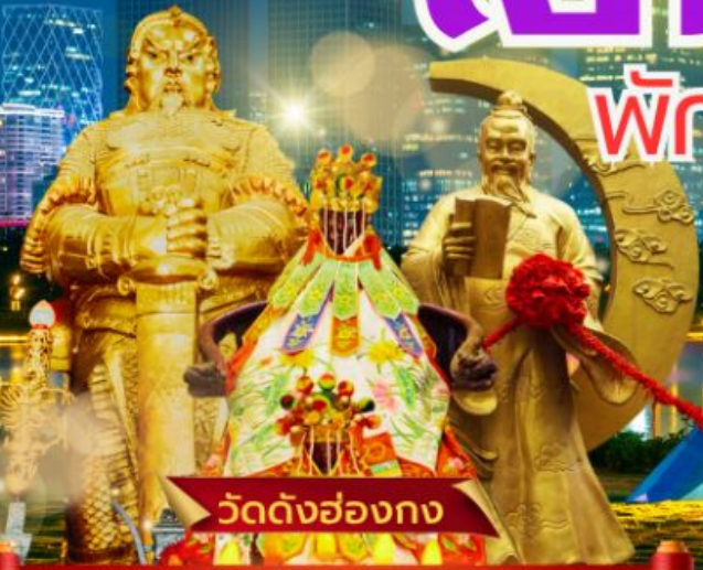
วัดดั่งฮ่องกง