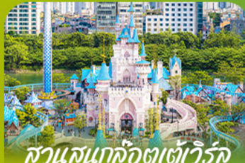
สวนสนุกลิตเติ้ลวีร์ส Lotte Adventure World