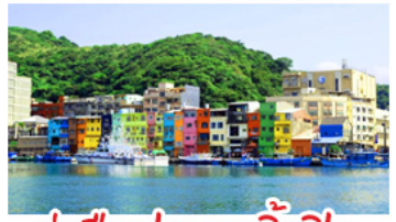
ทำเรือประมงเจิ้งปิ่น

รถไฟสายโบราณอาลีซาน - ตึกไทเป 101 ประมงเจิ้งปิ่น - จิวเฟิ่น - ล่องเรือทะเลสาบสุริยัมจินตรา ทานเมมูเค็ด เสี่ยวหลงเป่า & ปลาประจานาธิบดี ช้อปปิ้ง 3 ย่านดัง : ซิเหมินตง - ไทจงไนท์มาร์เก็ต - MITSUI OUTLET