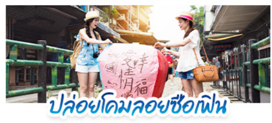
ปล่อยโดมลอยซื้อก๊ฟฟิน