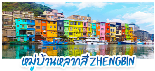
หมู่บ้านหลากสี ZHENGBIN