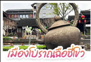
เมืองโบราณฉือชี่เซว