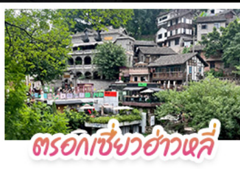
ตรอกเซี่ยวฮ่าวเสี