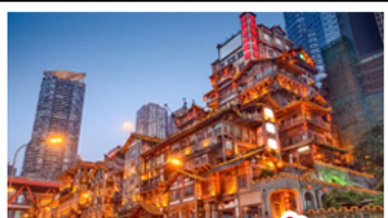
ตลาดเฉิงชิ่ง