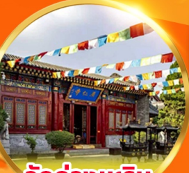
วัดกวางเหริน