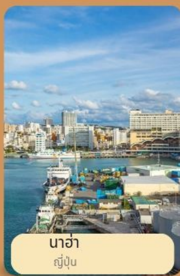
นาฮา ญี่ปุ่น