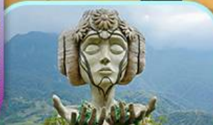
Moana Sapa Cafe