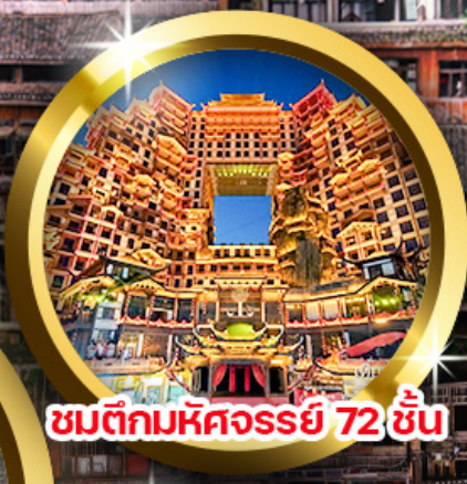
ชมตึกมหัศจรรย์ 72 ชั้น