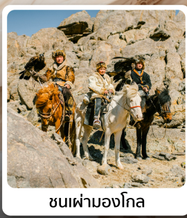
ชนเผ่ามองโกล