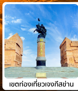
เขตท่องเที่ยวเจงกีสข่าน