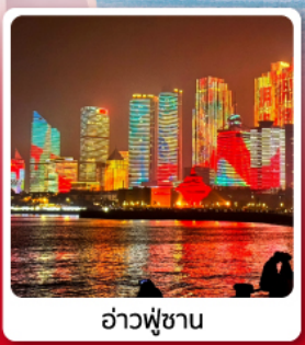
อ่าวฟูซาน