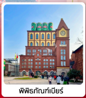
พิพิธภัณฑน์เกี๋ย