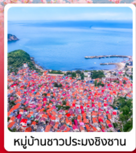
หมู่บ้านชาวประมงชิงซาน