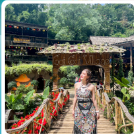
หมู่บ้านก๊ต ก๊ต

• โฮลท์ พิชิตยอดเขาฟานซีปัน หลังคาแห่งอินโดจีน สัมผัสหมู่บ้านชาวเขา หมู่บ้านก๊ต ก๊ต