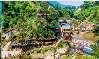
หมู่บ้านก๊ต ก๊ต