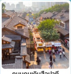
ถนนคนเดินสี่ปาตี