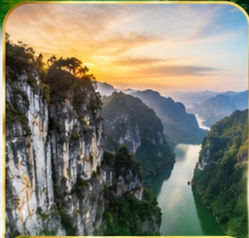
ช่องเรือ เหมาเหยียนเหอ