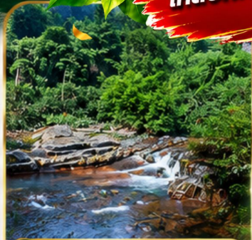
อุทยานผ่งเลี่ยนซี