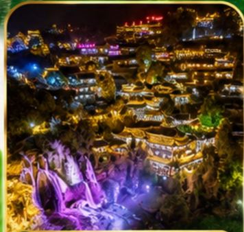
เมืองโบราณผู่หลงเจิ้น