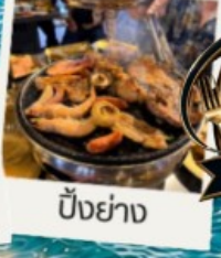
ปิ้งย่าง