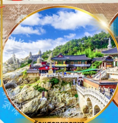
วัดแฮดงยงกุงซา