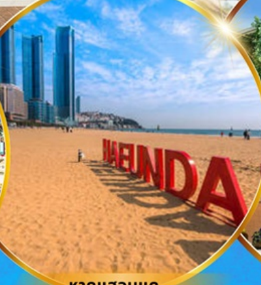
หาดแฮนแด