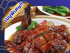
เป็ดย่างฮ่องกง