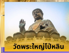
วัดพระใหญ่โปหลิน