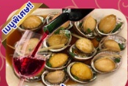
ซีฟู้ด เป้าฮ้อ+ไวน์แดง