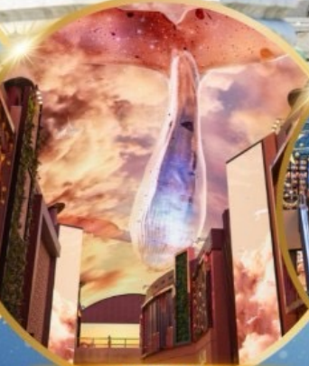
INSPIRE Entertainment Resort