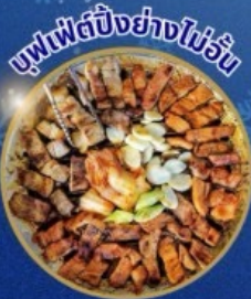
บุฟเฟ่ต์ปิ้งย่างไม่วัน