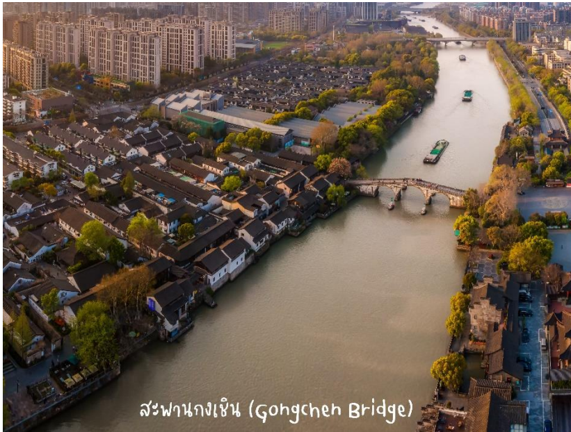
สะพานกงเฉิน (Gongchen Bridge)