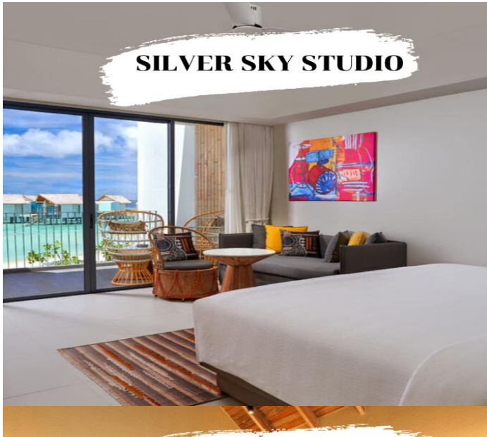
SILVER SKY STUDIO