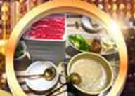
บุฟเฟ่ต์ชาบู เบียร์ไม่อั้น!!