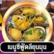
เมามูซีฟูคัสี่ยมบูน