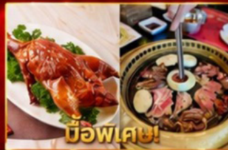
เปิดอย่างฮ่องกง บูฟเฟต์ปึงย่างเกาหลี