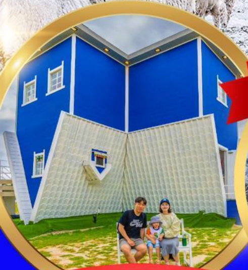
UPSIDE DOWN HOUSE