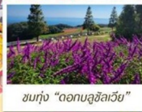
ชมทุ่ง "ดอกบลูซิลเวีย"