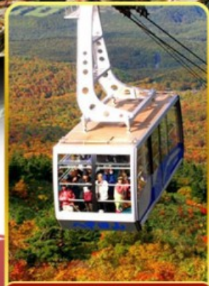
นั่งกระเช้าอากิโกะ