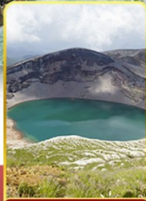
ปากปล่องภูเขาไฟฮาโอะ