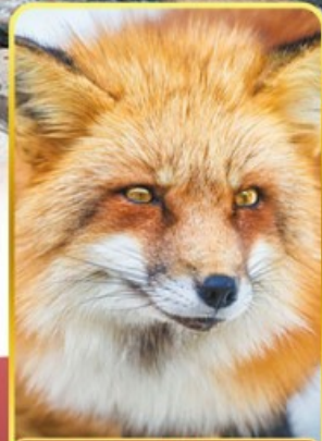
ฟาร์มสุนัขจิ้งจอก