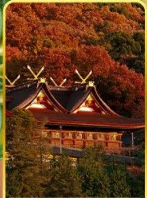
ศาลเจ้าคิบิฮิโกะ