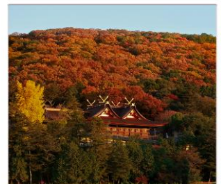
ศาลเจ้าคินิชิอิโกะ