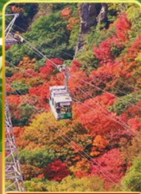
กระเช้าหุบเขาคังคาเคอิ