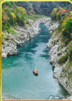
ล่องเรือช่องเขาโอโมเคะ