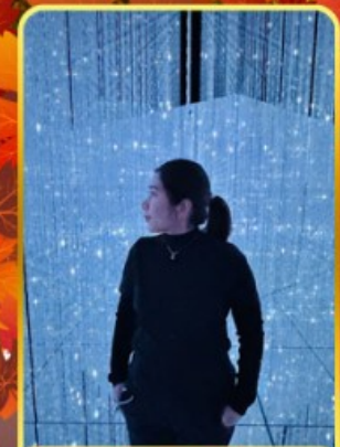
ทีมแอปโตเกียว