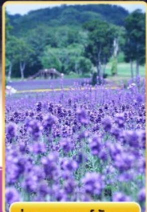
ทุ่งลาเวนเดอร์ทามบาระ