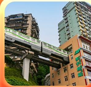
“นั่งรถไฟทะลุตึก”