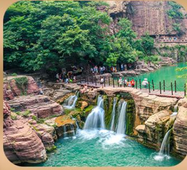
“อุทยานหยุนไต้ซาน”

ชมถ้ำหลงเหมิน มรดกโลกที่เมืองลั่วหยาง • สุสานจีนซีฮ่องเต้ • ศาลเจ้ากวนอู วัดเส้าหลิน + ป่าเจดีย์ + ชมโชว์กังฟู • เมืองโบราณลั่วอี้ • อุทยานหยุนไต้ซาน เจดีย์ห่านป่าใหญ่ • ถนนวัฒนธรรมต้าถัง • ถนนคนเดินอิสลาม • จัตุรัสหอระบิง