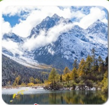
"ปี้เผิงโกว"

ชมความงาม 2 อุทยาน • สีดรุณี ช่องเขี้ยวโกว + ปี้เผิงโกว • พระใหญ่เล่อซาน สะพานหนานเจียว น้ำตาสีฟ้า • ห้องสมุดสุดเก๋ จงซูเก๋อ • แพนด้ายักษ์บนอนเซลฟ์ ชอยกว้างชอยแคบ • ถนนคนเดินชุนซีลู่ • แพนด้ายักษ์ปิ่นตึก • ถนนคนเดินจินหลี่