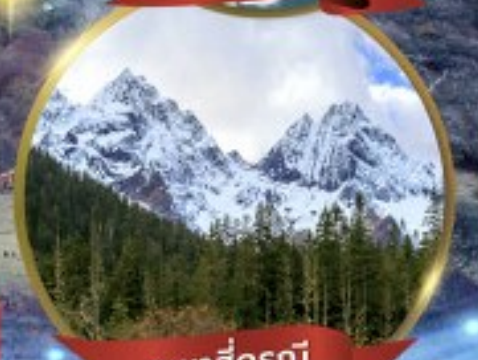
ภูเขาสี่ฤดู