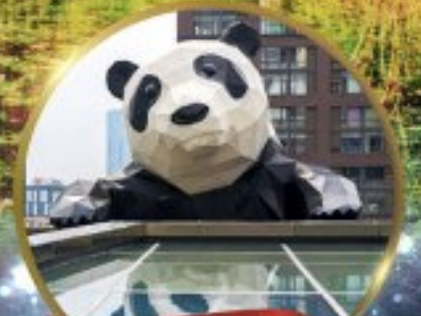
แพนด้ายักษ์

มหัศจรรย์ความงาม อุทยานจิวจ้ายโกว (รวมรถเหมาเที่ยวอุทยานเต็มวัน) ชมอุทยานหวงหลง (รวมกระเช้า) • สี่ฤดู • อุทยานของเขี้ยวโกว (รวมรถอุทยาน) เมืองเก่าชงฟาน • ถนนคนเดินจิมฮลี + ไถ่ตู้ฮลี • ชมแพนด้ายักษ์ป็นตึก