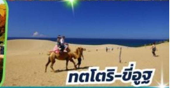
ทตโตริ-ซ็องสุ