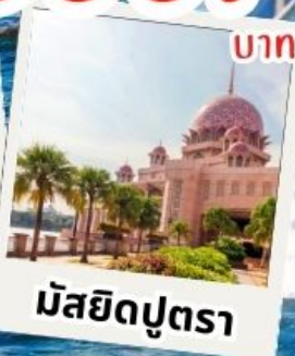
มัสยิดบุตรา