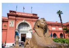
The Egyptian Museum

** พักที่ Saray Pyramids & Museum View Hotel 4* หรือเทียบเท่า **