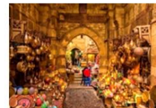
ตลาดขานเอลคาลิลี

19.50 น. เดินทางสู่ท่าอากาศยาน QUEEN ALIA ประเทศจอร์แดน เที่ยวบินที่ RJ 506