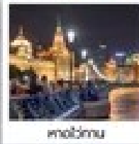
พิพิธภัณฑ์