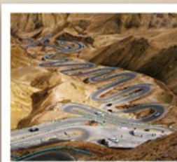
ถนนโบราณผานหลง