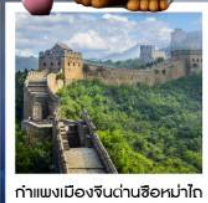
กำแพงเมืองจีนด่านซือหม่าไท่

เมืองโบราณกุ่เป่ย์สู่ยจิ้น / กำแพงเมืองจีนด่านซือหม่าไท่ (รวมค่ากระเช้าขึ้น-ลง) / ชมวิวกำแพงเมืองจีนและเมืองโบราณ ยูนิเวอร์แซลปักกิ่ง (รวมค่าบัตรเข้า) / จัตุรัสเทียนอันเหมิน / พระราชวังโบราณกู้กง / หอบูชาเทียนถาน คาเฟ่กาแฟบ้านน้ำตาล (TANG FANG CAFE) / พระราชวังฤดูร้อนอวิ๋เหอหยวน / ย่านชานหลี่ถุน (POP MART) / ถนนคนเดินไท่กู่หลี่