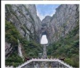
เขาคิยงเหมินชาน

จางเจียเจีย • เขาวงตาร • ฟังหวง • ฟู่หรงเจิ้น • ฉางซา