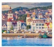
ท่าเรือประมงเหยียนโก๋