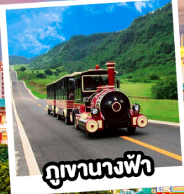
ภูเขาฉางฟ้า